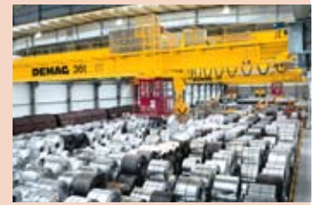
Prozess-Krane (Demag Cranes & Components)