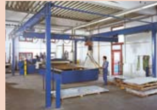
Aufgeständertes Kran-System (Vetter Fördertechnik)