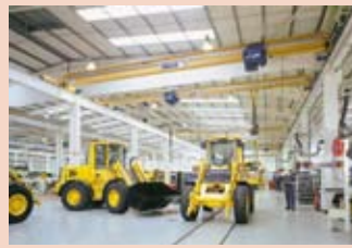
Einträgerlaufkran (Abus Kransysteme)