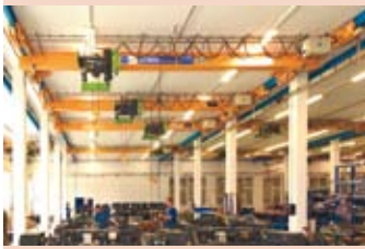
Einträgerhängekran (Stahl Crane Systems)