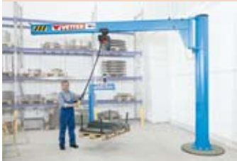
Schwenkkrane (Vetter Fördertechnik)