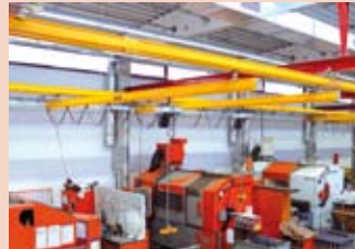
Arbeitsplatzkrane (SWF Krantechnik)